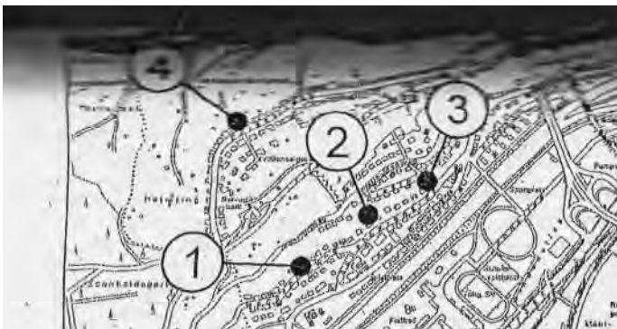
Vorschlag 4 aus Vorlage: „Nicht realisierte Fußwegeverbindung“

Anmerkung: Es gibt auch noch den Vorschlag 22 Burgholzweg - Schwarzlocher Straße in der Vorlage. Diese Verbindung liegt Zentrumsnahe, konnte aber nicht gefunden werden!